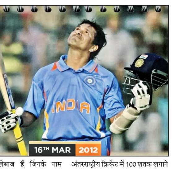
एकमात्र बल्लेबाज हैं जिनके नाम अंतरराष्ट्रीय क्रिकेट में 100 शतक लगाने का रिकॉर्ड है। उन्होंने अपने अंतरराष्ट्रीय क्रिकेट करियर में टेस्ट में 51 और वनडे में 49 शतक लगाए हैं। सचिन के बाद मौजूदा भारतीय टीम के स्टार बल्लेबाज विराट कोहली अंतरराष्ट्रीय क्रिकेट में सर्वाधिक शतक लगाने के मामले में दूसरे स्थान पर हैं। कोहली अब तक अपने अंतरराष्ट्रीय करियर में 82 शतक लगा चुके हैं, लेकिन अभी भी वह सचिन से काफी पीछे हैं। हालांकि, विराट वनडे में शतक लगाने के मामले में सचिन को पीछे छोड़ चुके हैं। कोहली वनडे में 51 शतक लगा चुके हैं, जबकि सचिन के वनडे में 49 शतक हैं, लेकिन ओवरऑल कोहली अभी सचिन से बहुत पीछे हैं। कोहली के वनडे में 51, टेस्ट में 30 और टी20 में एक शतक है। कोहली टी20 अंतरराष्ट्रीय से रिटायरमेंट ले चुके हैं। वनडे और टेस्ट फार्मेट में खेल रहे हैं। फिलहाल कोहली

नई दिल्ली भारतीय टीम के पूर्व दिग्गज बल्लेबाज सचिन तेंदुलकर को क्रिकेट में विश्व के सबसे महान बल्लेबाजों में से एक माना जाता है। उन्होंने अपने क्रिकेट करियर में अनेक रिकॉर्ड अपने नाम किए हैं। उनके कई रिकॉर्ड ऐसे हैं, जिन्हें अब तक कोई नहीं तोड़ सका है। उन्हीं में से एक रिकॉर्ड ऐसा है, जिसे शायद ही कोई बल्लेबाज तोड़ पाए। हम बात कर रहे हैं अंतरराष्ट्रीय क्रिकेट में सौ शतकों के रिकॉर्ड की। महान बल्लेबाज ने यह उपलब्धि आज ही के दिन साल 2012 में हासिल की थी। आज उनके इस रिकॉर्ड को 13 साल हो गए हैं और उनका यह महारिकॉर्ड अभी भी कायम है। बांग्लादेश के खिलाफ हासिल की थी उपलब्धि मास्टर ब्लास्टर के नाम से मशहूर सचिन ने अंतरराष्ट्रीय क्रिकेट में