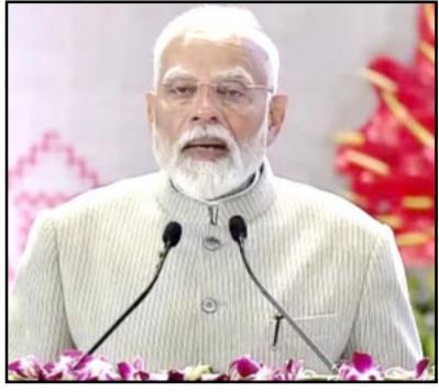
कच्चे माल से लेकर तैयार उत्पादों तक वस्त्रों की संपूर्ण मूल्य श्रृंखला को एक ही मंच पर लाने वाला एक अनूठ कार्यक्रम है। पीएम मोदी ने

नई दिल्ली। प्रधानमंत्री नरेंद्र मोदी ने भारत मंडपम में भारत टेक्स 2025 को संबोधित किया। इस दौरान उन्होंने कहा कि भारत टेक्स का दूसरा सत्र भारत मंडपम में आयोजित किया जा रहा है...भारत टेक्स हमें हमारी परंपरा के साथ-साथ विकसित भारत की भी झलक दिखाता है...हमने जो बीज बोया है, वह बहुत तेजी से बढ़ रहा है। इससे पहले प्रधानमंत्री नरेंद्र मोदी ने भारत टेक्स 2025 में एक प्रदर्शनी का दौरा किया। प्रधानमंत्री ने प्रतिभागियों से बातचीत की और उन्हें प्रदर्शनी के कई पहलुओं के बारे में जानकारी दी गई। पीएम मोदी ने आगे कहा कि भारत टेक्स एक बड़ा वैश्विक आयोजन है, इसमें 120 अधिक देश भाग ले रहे हैं। बता दें कि, भारत टेक्स 2025 का आयोजन 14-17 फरवरी को भारत मंडपम में किया जा रहा है। यह