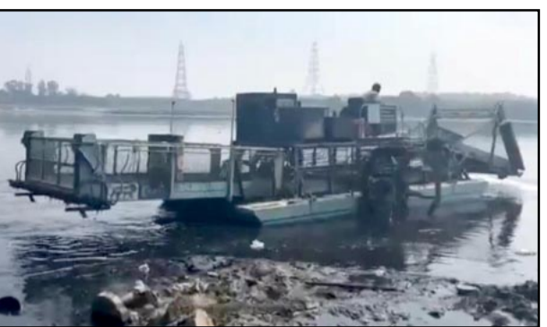
के उपराज्यपाल कार्यालय ने आगे बताया कि उन्होंने इस मुद्दे से निपटने के लिए चार-आयामी रणनीति बनाई गई है। उन्होंने बताया कि पहली रणनीति में, यमुना नदी की धारा में मौजूद कचरा, कूड़ा और गंद को हटाया जाएगा। दूसरी रणनीति में, नजफगढ़ नाले, पूरक नाले और अन्य सभी प्रमुख नालों में सफाई अभियान शुरू किया जाएगा।

नई दिल्ली। दिल्ली विधानसभा चुनाव में प्रधानमंत्री नरेंद्र मोदी द्वारा किए गए वादे के बाद आज से यमुना नदी की सफाई शुरू हो गई है। रविवार को देश स्कीम, वीड हावैस्टर और ड्रेज यूटिलिटी क्राफ्ट जैसी मशीनों से यमुना नदी की सफाई शुरू की गई। बता दें, पीएम मोदी ने कहा था कि दिल्ली चुनाव जीतने के बाद भाजपा सबसे पहले यमुना नदी को सफाई करेगी। दिल्ली के उपराज्यपाल कार्यालय ने यमुना नदी की सफाई की जानकारी देते हुए कहा कि मुना नदी की सफाई का काम पहले ही शुरू हो चुका है। कचरा निकालने वाली मशीनें, खरपतवार निकालने वाली मशीनें और ड्रेज यूटिलिटी क्राफ्ट आज से नदी में सफाई अभियान शुरू कर चुके हैं। दिल्ली के उपराज्यपाल वीके स्कन्धाने ने कल मुख्य सचिव और अतिरिक्त मुख्य सचिव (आई एंड एफसी) से मुलाकात की और उन्हें तुरंत काम शुरू करने को कहा था। दिल्ली