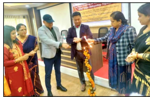
मुख्य अतिथियों द्वारा दीप प्रज्वलन के साथ हुई। इस दो दिवसीय कार्यक्रम में स्वास्थ्य एवं चिकित्सा, आहार विशेषज्ञ, फिजियोथेरेपी, और सॉफ्ट