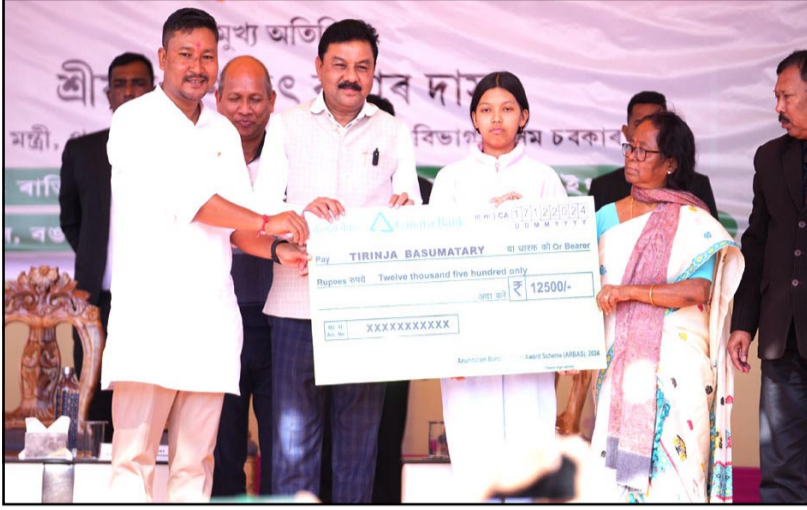
कुल 747 छात्रों को डॉ. बाणीकांत काकती पुरस्कार के तहत स्कूटी वितरित की गई। इसके अलावा, जिले में 9वाँ कक्षा में अध्ययनरत कुल 8,059 छात्रों को साइकिल प्रदान की गई।

बंगाईगांव (हिंस)। असम सरकार के मंत्री रंजीत दास ने कहा है कि असम के प्रत्येक जिले के विकास और उज्ज्वल भविष्य को ध्यान में रखते हुए शिक्षा, उद्योग, वित्त और राजस्व विभाग की योजनाओं को जोड़ते हुए मुख्यमंत्री डॉ. हिमंत विश्व शर्मा के नेतृत्व वाली राज्य सरकार की उल्लेखनीय पहल विकास के 12 दिन के अंतर्गत मंगलवार को बंगाईगांव उच्चतर माध्यमिक विद्यालय के खेल मैदान में आयोजित पुरस्कार वितरण समारोह में शामिल होकर अत्यंत प्रसन्न हूँ। मंत्री ने सोशल मीडिया के जरिए कहा कि बंगाईगांव जिले के शैक्षणिक संस्थानों से हाई स्कूल अंतिम परीक्षा में 75 फीसदी या उससे अधिक अंक प्राप्त करने वाले कुल 424 छात्रों को आनंदराम बरुवा पुरस्कार के तहत 12,500 रुपये की आर्थिक सहायता प्रदान की गई। इस कार्यक्रम में जिले के कुल 39 शैक्षणिक संस्थानों से उच्चतर माध्यमिक परीक्षा में 60 फीसदी या उससे अधिक अंक प्राप्त करने वाले