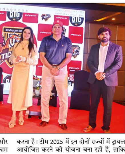
एमपी टाइगर्स का लक्ष्य मध्य प्रदेश और छत्तीसगढ़ में क्रिकेट के विकास के लिए काम करना है। टीम 2025 में इन दोनों राज्यों में ट्रायल आयोजित करने की योजना बना रही है, ताकि

इन्दौर रेंडिसन होटल, इन्दौर में मध्य प्रदेश और छत्तीसगढ़ की अपनी क्रिकेट टीम एमपी टाइगर्स का आधिकारिक तौर पर अनावरण किया गया। सूरत में 12 दिसंबर से शुरू होने वाले बिग क्रिकेट लीग (बीसीएल) में एमपी टाइगर्स टीम ने क्रिकेट जगत में एक नया अध्याय जोड़ दिया है। स्पोर्ट्समिंट के स्वामित्व वाली एमपी टाइगर्स टीम का लक्ष्य मध्य प्रदेश और छत्तीसगढ़ के युवा क्रिकेट प्रतिभाओं को एक मंच प्रदान करना है। इस क्षेत्र में क्रिकेट को बढ़ावा देने के उद्देश्य से, एमपी टाइगर्स ने बीसीएल में भाग लेने का फैसला किया है। बीसीएल एक अनूठ टूर्नामेंट है जो पेशेवर, युवा, मेहनती मौके को तलाश कर रहे क्रिकेटर्स को खेलने का मौका देता है। एमपी टाइगर्स ने अपने स्काउड में 10 महत्वाकांक्षी और 8 अंतर्राष्ट्रीय खिलाड़ियों को शामिल किया है। इन खिलाड़ियों का चयन पूरे भारत में आयोजित हुए कई शिविरों के माध्यम से किया गया है।