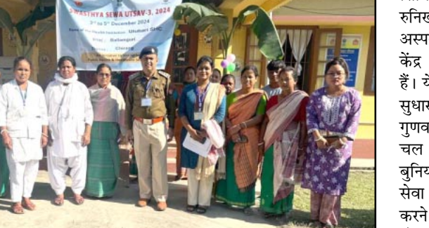
केंद्र (सीएचसी) और प्राथमिक स्वास्थ्य केंद्र (पीएचसी) शामिल हैं, जिनमें से सभी का कठोर मूल्यांकन किया जा रहा है। प्रतिभागियों को आज इन स्वास्थ्य सुविधाओं के भीतर गतिविधियों का पता लगाने, चिकित्सा कर्मचारियों और रोगियों दोनों के साथ जुड़ने और ध्यान देने की आवश्यकता वाले सिस्टम में किसी भी अंतर की पहचान करने का अनूठा

चिरांग। स्वास्थ्य सेवा उत्सव (एसएसयू) का बहुप्रतीक्षित तीसरा दौर आज से शुरू हो गया है, जो पिछले दौर की सफलता के बाद शुरू हुआ है। 3 से 5 दिसंबर 2024 तक चलने वाला एसएसयू-3.0 पूरे क्षेत्र में स्वास्थ्य सेवा सुविधाओं को और बेहतर बनाने पर केंद्रित है। पिछले दौर की कार्यप्रणाली पर आधारित गतिविधियों में आंतरिक और बाह्य दोनों तरह के आकलन शामिल थे। साथ ही वरिष्ठ जिला अधिकारियों और प्रसिद्ध मेडिकल कलेजों के मेडिकल फैकल्टी द्वारा मूल्यांकन भी शामिल था। इसका लक्ष्य व्यापक स्वास्थ्य सेवा वितरण सुनिश्चित करना और निकट भविष्य में भारतीय सार्वजनिक स्वास्थ्य मानकों (आईपीएचएस) को पूरा करने के लिए एडवांस के क्षेत्रों की पहचान करना था। इस दौर में पांच एससी-आयुष्मान आरोग्य मंदिर केंद्रों के साथ-साथ जिला अस्पताल (डीएच), उप-मंडल सिविल अस्पताल (एसडीसीएच), सामुदायिक स्वास्थ्य