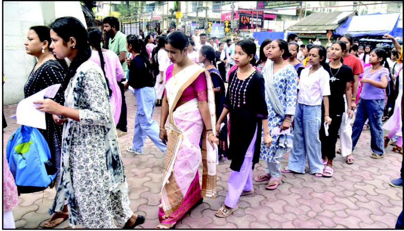
गुवाहाटी में ग्रेड-थ्री परीक्षा केंद्र में प्रवेश करने के लिए कतार में प्रतीक्षा करते परीक्षार्थी।

गुवाहाटी। असम सरकार के ग्रेड-थ्री पदों पर भर्ती के लिए लिखित परीक्षा रविवार को राज्य भर में व्यापक व्यवस्था और आठ घंटे के मोबाइल इंटरनेट निलंबन के बीच आयोजित की गई। आधिकारिक सूत्रों ने बताया कि कुल 7,34,080 उम्मीदवार असम सीधो भर्ती परीक्षा (एडीआरई) के दूसरे चरण के लिए उपस्थित होने के पात्र थे, जो स्नातक डिग्री स्तर और एचएसएलसी स्तर के पदों के लिए आयोजित किया जा रहा था। सितंबर में यह दूसरी बार है जब परीक्षा के दौरान गडबडी रोकने के लिए राज्य में मोबाइल इंटरनेट सेवाएं निलंबित की गई हैं। सूत्रों ने बताया कि दो सत्रों में