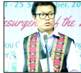
एफआईआर भी दर्ज करवाई है। एफआईआर में उन्होंने 15 लोगों को जिम्मेदार ठहराया है, जिन्होंने उनके परिवार पर हमले किए। भाजपा प्रवक्ता ने आगे आरोप लगाया कि दो लोगों ने कुछ

भाजपा प्रवक्ता को मिली जान से मारने की धमकी, सीएम ने जताई चिंता