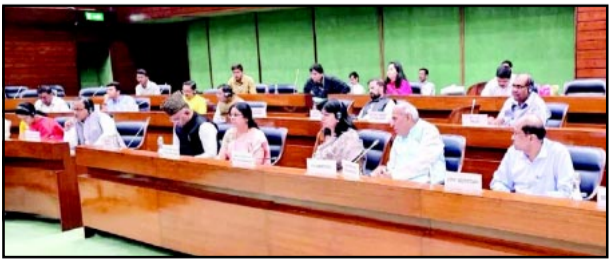
इंडियन मुस्लिम फॉर सिविल राइट्स संस्था ने भी जेपीसी समिति ने विधेयक के व्यापक प्रभावों को देखते हुए आम जनता, गैर सरकारी संगठनों, विशेषज्ञों, हितधारकों और संस्थानों से विशेष रूप से विचार मांगे हैं। अगले 15 दिनों के भीतर लोगों से

नई दिल्ली। वक्फ संशोधन विधेयक पर शुक्रवार को संसद की संयुक्त समिति (जेपीसी) की दूसरी बैठक हुई। इसमें मुस्लिम संगठनों के विचार जाने गए। इसमें ऑल इंडिया सुनी जमीयत उलेमा ने बिल का किया विरोध। उलेमा ने कहा कि हमें संशोधन मंजूर नहीं है। वक्फ मुसलमानों का मामला है। सरकार दखल ना दे।