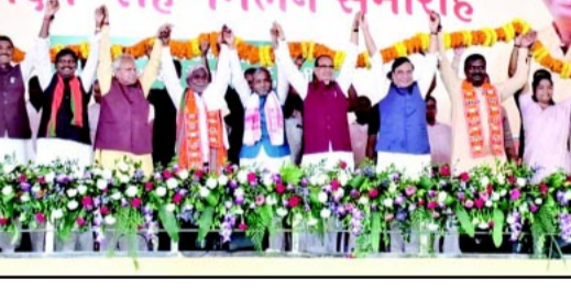
रांची ( हि.स. )। केंद्रीय कृषि मंत्री सह झारखंड के चुनाव प्रभारी शिवराज सिंह चौहान ने कहा कि चम्पाई सोरेन ने झारखंड के निर्माण के लिए अपनी जिदगी और जवानी खपा दी। राज्य की जनता की सेवा में दिन रात

और राष्ट्रीय महामंत्री (संगठन) बीएल संतोष भाजपा को ओर से बैठक में हिस्सा लेने पहुंच गए हैं। आरएसएस के सरसंचालक मोहन भागवत समेत 32 से अधिक अनुपांगिक