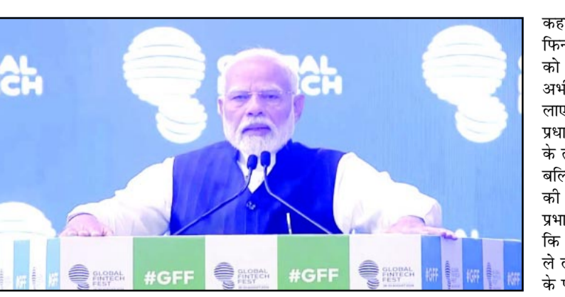
कहा कि मुझे विश्वास है कि भारत का फिनटेक इकोसिस्टम पूरी दुनिया के जीवन को आसान बनाएगा। हमारा सर्वश्रेष्ठ आना अभी बाकी है। देश में फिनटेक उद्योग द्वारा लाए गए बदलावों का उल्लेख करते हुए प्रधानमंत्री ने कहा कि इसने न केवल भारत के तकनीकी मोर्चे को बदल दिया गया है, बल्कि शहरी और ग्रामीण भारत के बीच की खाई को पाटकर व्यापक सामाजिक प्रभाव भी डाला है। मोदी ने आगे बताया कि वही बैंकिंग सेवाएं जो पहले पूरा दिन ले लेती थीं और किसानों और मध्यम वर्ग के परिवारों के लिए

नई दिल्ली ( हि.स. )। प्रधानमंत्री नरेंद्र मोदी ने शुक्रवार को मुंबई के जियो वर्ल्ड कन्वेंशन सेंटर में ग्लोबल फिनटेक फेस्ट (जीएफएफ) को संबोधित करते हुए संकेत दिए कि उनका इरादा लंबे समय तक सत्ता में बने रहने का है। प्रधानमंत्री ने विश्वास व्यक्त करते हुए कहा कि यह पांचवां ग्लोबल फिनटेक फेस्ट है। दसवें फिनटेक फेस्ट को संबोधित करने के लिए भी यहाँ आऊंगा। प्रधानमंत्री ने विश्वास व्यक्त करते हुए कहा कि भारत का फिनटेक इकोसिस्टम भारत के लोगों को गुणवत्तापूर्ण जीवनशैली प्रदान करने में बहुत बड़ी भूमिका निभाएगा। उन्होंने