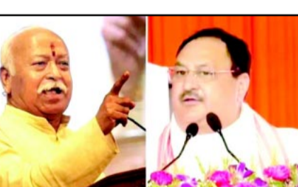
संगठनों से जुड़े 320 प्रतिनिधि बैठक में मौजूद होंगे। सुनील आंबेकर के अनुसार बैठक में बांग्लादेश में हिंदुओं के

समन्वय बढ़ाने पर विचार किया जाएगा। ध्यान देने की बात है कि लोकसभा चुनाव में अपेक्षित परिणाम नहीं मिलने के पीछे आरएसएस और भाजपा के बीच समन्वय की कमी को भी एक कारण माना जा रहा था। लोकसभा चुनाव के बाद समन्वय को लेकर हो रही बैठक को अहम माना जा रहा है। भाजपा अध्यक्ष जेपी नड्डा