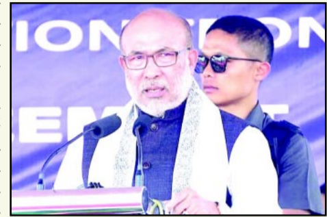
सिंह ने कहा था कि संवाद ही एकमात्र रास्ता है। आईटीएलएफ के प्रवक्ता

नई दिल्ली। मणिपुर के कुकी नेताओं के प्रमुख संगठन इंडीजिनस ट्रायबल लीडर्स फोरम (आईटीएलएफ) ने शुक्रवार को कहा कि केंद्र के साथ अगर कोई बातचीत होगी तो उनकी शर्तों पर होगी। संगठन ने मुख्यमंत्री एन.बीरेन सिंह की ओर से नियुक्त दूत से किसी भी तरह की बातचीत की संभावना को खारिज किया। इससे पहले गुरुवार को एन. बीरेन