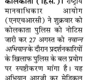
कोलकाता ( हि.स. )। राष्ट्रीय मानवाधिकार आयोग (एनएचआरसी) ने शुक्रवार को कोलकाता पुलिस को नोटिस जारी कर 27 अगस्त को नवान्व अभियान के दौरान प्रदर्शनकारियों के खिलाफ पुलिस के बल प्रयोग पर स्पष्टीकरण मांगा है। यह अभियान आरजी कर मेडिकल कॉलेज एवं अस्पताल की महिला जूनियर डॉक्टर के साथ दुष्कर्ष एवं हत्या के विरोध में चलाया गया था। सुर्ज के मुताबिक एनएचआरसी ने कोलकाता पुलिस से अगले 14 दिनों के भीतर रिपोर्ट मांगी है। आयोग का मानना है कि सोशल मीडिया पर छात्रों के एक समूह द्वारा बुलाए

एनएचआरसी ने कोलकाता पुलिस को नोटिस जारी किया