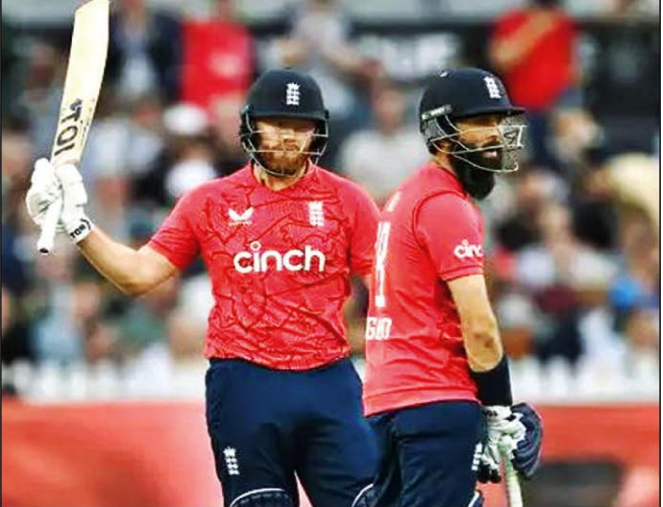
क्रिकेटर्स को दी जाने वाली प्रथमिकता को दर्शाता है।

दोनों ही टीमों के कप्तानों शान मसूद और नजमुल हुसैन शांतो ने अपराधों के लिए दोषी होने की बात मान ली है। ऐसे में आगे सुनवाई की जरूरत नहीं रहेगी।