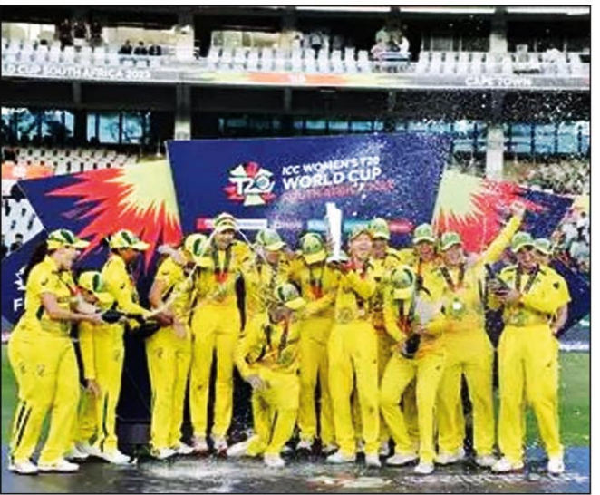
अक्टूबर को दुबई में पहला सेमीफाइनल खेलेंगे।

दुबई। अंतरराष्ट्रीय क्रिकेट परिषद (आईसीसी) ने सोमवार देर रात आगामी महिला टी-20 विश्व कप के लिए संशोधित कार्यक्रम घोषित कर दिए हैं। दुबई 6 अक्टूबर को भारत और पाकिस्तान के बीच बहुपक्षीय मुकाबले और 20 अक्टूबर को 18 दिवसीय टूर्नामेंट के फाइनल की मेजबानी भी करेगा। बांग्लादेश के लिए चल रहे राजनीतिक संकट के कारण टूर्नामेंट की मेजबानी करना असंभव हो गया था, जिसके बाद टूर्नामेंट को यूएई में स्थानांतरित कर दिया गया था।