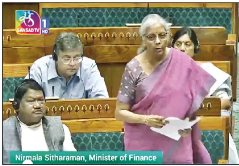
Nirmala Sitharaman, Minister of Finance